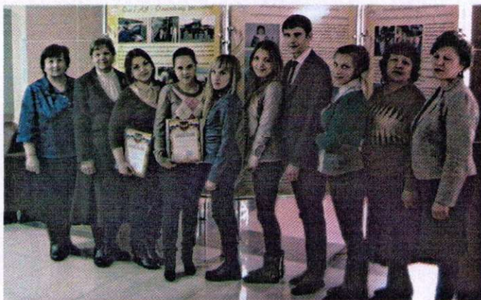
Областная конференция учебно-научно-исследовательских проектов

(физика, химия, биология, экология, математика и информационные тех-