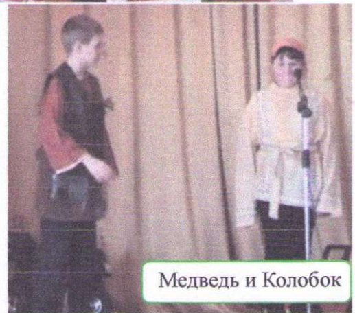
Медведь и Колобок